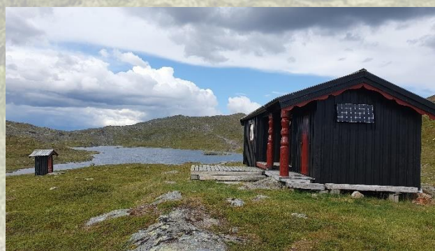
Skjellåbua fikk seg et etterlenget malingsstrøk i løpet av sommeren.

Fjellstyret blir til enhver tid oppdatert over pågående skyting, og samarbeidet har fungert godt. I slutten av 2023 ble det imidlertid orientert bredt om en kraftig økning av bruken av områdene til trening av ukrainske soldater. Dette vil få konsekvenser for både bruk av området, men Forsvaret har signalisert at de vil prøve å legge til rette for allmenn aktivitet så lenge det planlegges.