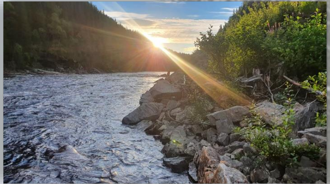
Laksefiske i solnedgang.

Denne sesongen har vært utfordrende med tanke på en intensivert bruk av Rørosbanen, der 6 tog i døgnet plutselig ble utvidet til 18. Dette har medført at det har oppstått flere farlige situasjoner hvor fiskere har gått langs, eller krysset, jernbanespolet foran tog som har kommet i full fart. Å krysse jernbanespolet er ulovlig, men i mangel på planoverganger kan det være fristende å velge korteste vei ned til elva. Fjellstyre vil i tiden framover jobbe for å utbedre adkomstmulighetene på vestsiden av elva, via Allmenningsvegen mellom Haltdalen og Singsås.