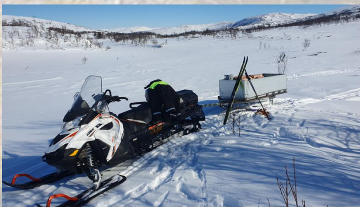
Oppsyn i fjellet kombineres med tilsyn av fjellstyrehyttene.

Saksbehandling har krevd mye tid også i 2023. For fjellstyrets del stilles det stadig strengere krav til saksbehandling, og saksforberedelser og oppfølging av saker er tidkrevende. Det er spesielt saker i henhold til seterforskriften og administrasjon av både småviltjakt, villreinjakt og elgjakt som krever mest tid og arbeid. Saksbehandling går gjerne på bekostning av oppsynsvirksomheten.