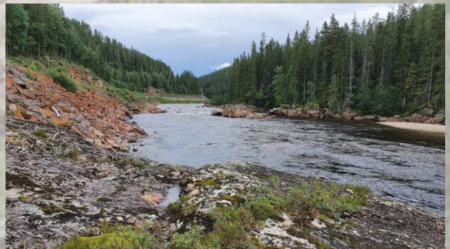
Dragåsen mellom Haltdalen og Singsås er en utsatt strekning for kryssing av jernbane.